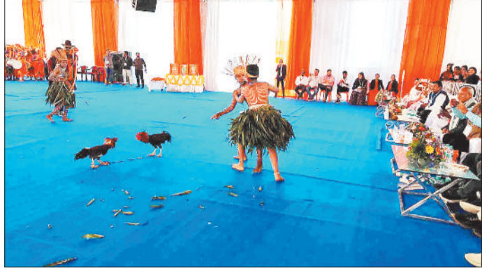
सांस्कृतिक कार्यक्रमों की प्रस्तुति देते कलाकार।