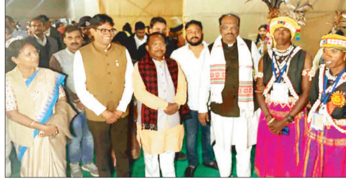
संस्कृति मंत्री ने किया निरीक्षण